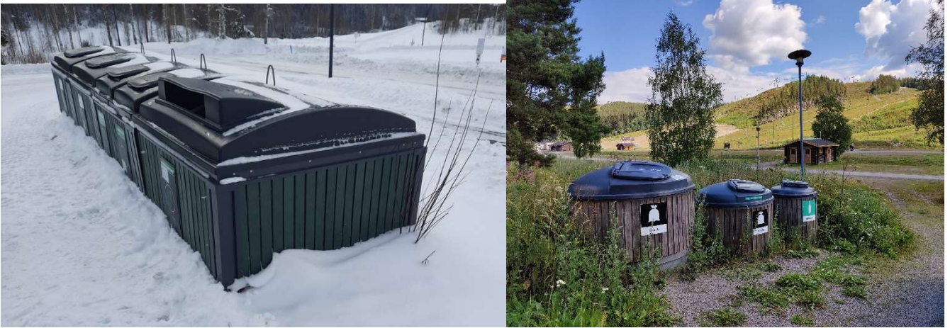
Kuva 1. Himoksen alueen aluekeräysjärjestelmän jätepisteet ovat syväkeräyspisteitä.